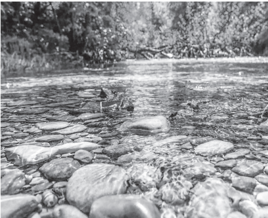
Der mächtige Grundwasserstrom der oberen Töss soll geschützt werden.

Um das Grundwasser der Töss besser zu schützen, sollen die bestehenden Abwasserreinigungsanlagen (ARA) im Tössstal stillgelegt und das Abwasser nach Winterthur geleitet werden. Dazu möchten die betroffenen Gemeinden und die Stadt Winterthur im Jahr 2020 eine gemeinsame Anstalt, die «Regionale Abwasserentsorgung Tössstal», gründen. Bis ins Jahr 2035 sollen dann in mehreren Etappen die verbleibenden ARA im Tössstal stillgelegt, und das Abwasser soll durch eine neue Verbindungsleitung an das städtische Abwassernetz angeschlossen werden. An diesen Baukosten wird sich die Stadt Winterthur zu 30 Prozent (maximal 11 Millionen Franken) beteiligen. Um die gemeinsame Anstalt zu gründen, ist die Zustimmung aller beteiligten Gemeinden erforderlich. Der Stadtrat und der Grosse Gemeinderat (mit 52 zu 0 Stimmen bei einer Enthaltung) beantragen, der Vorlage zuzustimmen.