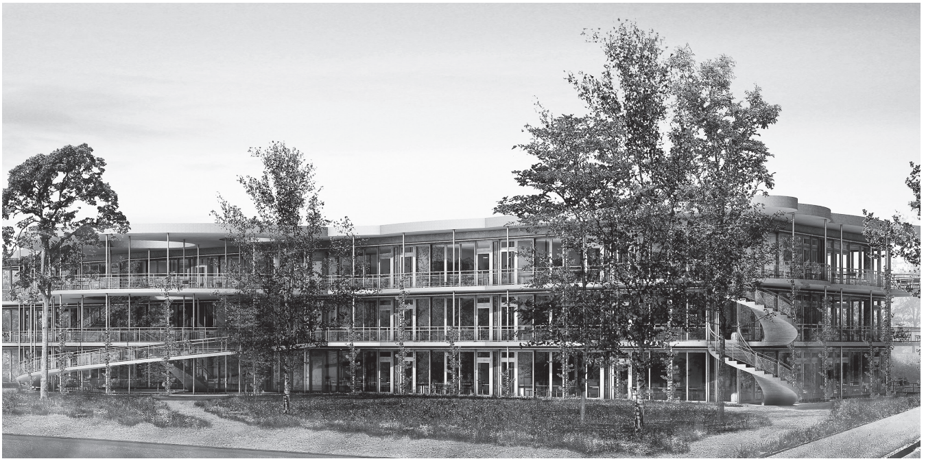
Visualisierung des neuen Sekundarschulhauses: Es wird nicht von innen, sondern vollständig von aussen erschlossen.

Stahlkonstruktion mit Cortenstahlfassade und gewollter Rostbildung ist heute baulich und statisch in so schlechtem Zustand, dass das Gebäude dringend ersetzt werden muss. Eine blosser Sanierung kann aus Sicherheitsgründen weder mittelfristig noch langfristig in Betracht gezogen werden und zeigt sich auch im finanziellen Vergleich als nicht vorteilhaft.