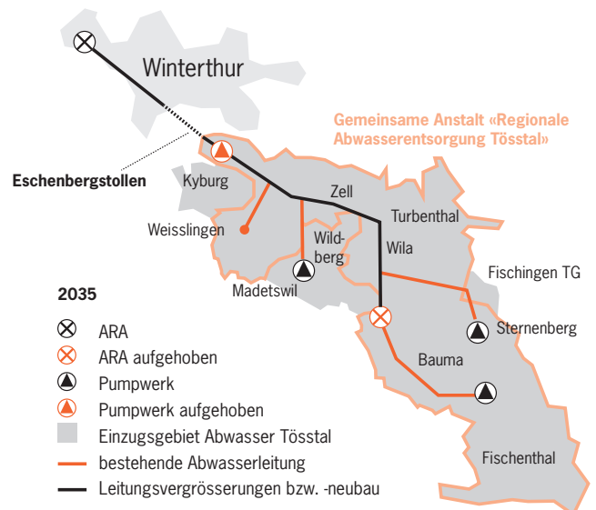
Die aktuelle Lage (links) und die Situation nach der geplanten Aufhebung der Tösstaler ARA und dem Anschluss an das städtische Abwassernetz (rechts).