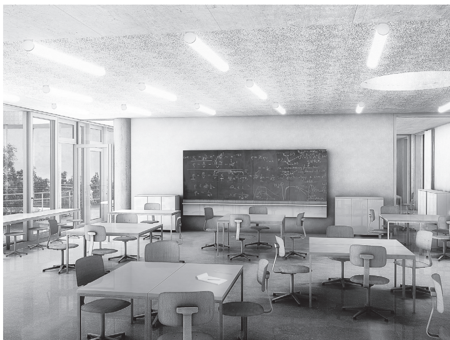
Klassenzimmer im neuen Schulhaus (Visualisierung).

Das bestehende Schulhaus Wallrüti, erbaut 1973, weist erhebliche bauliche Mängel auf. Die dazuzumal neuartige