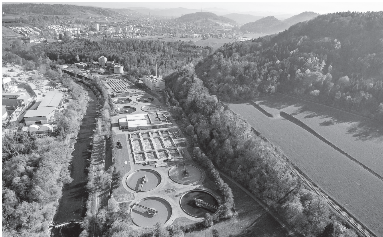
Die Winterthurer ARA in der Hard.

terthur. Weisslingen und Bauma betreiben eigene, kleine Abwasserreinigungsanlagen. Fischenthal ist seit 2016 an die ARA Bauma angeschlossen.